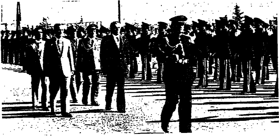
الرئيسان يستعرضان حرس الشرف